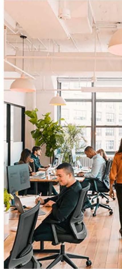
Bureaux à New York